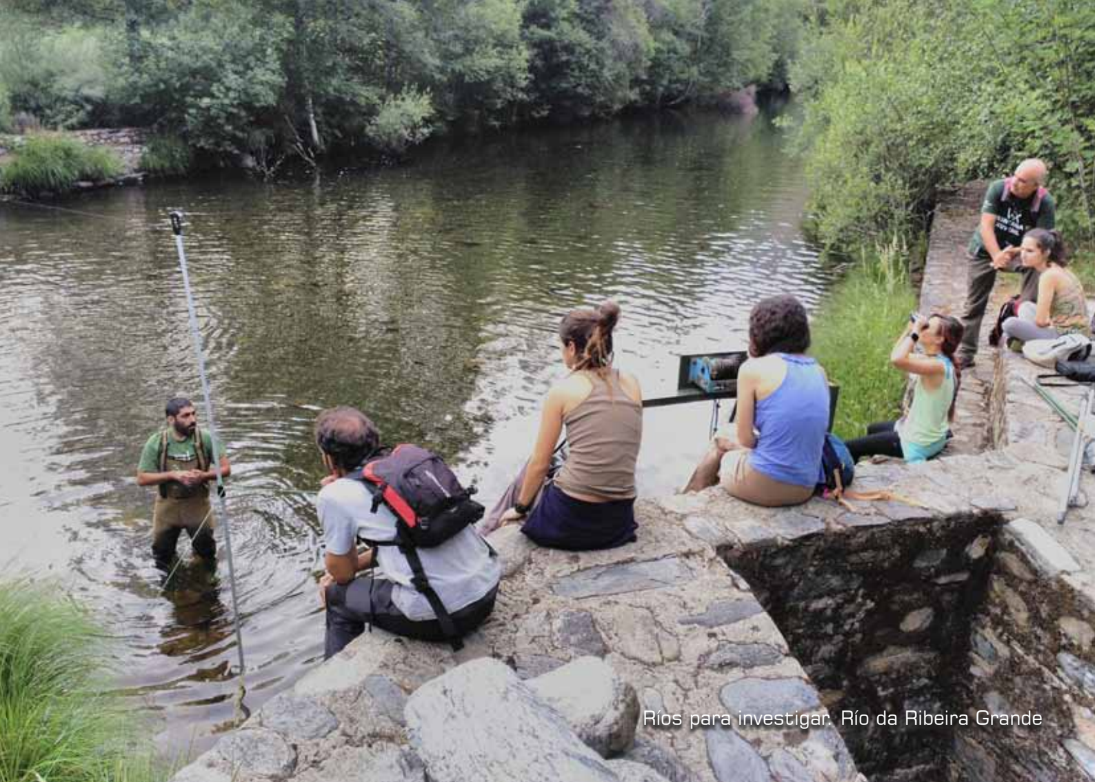
Ríos para investigar. Río da Ribeira Grande