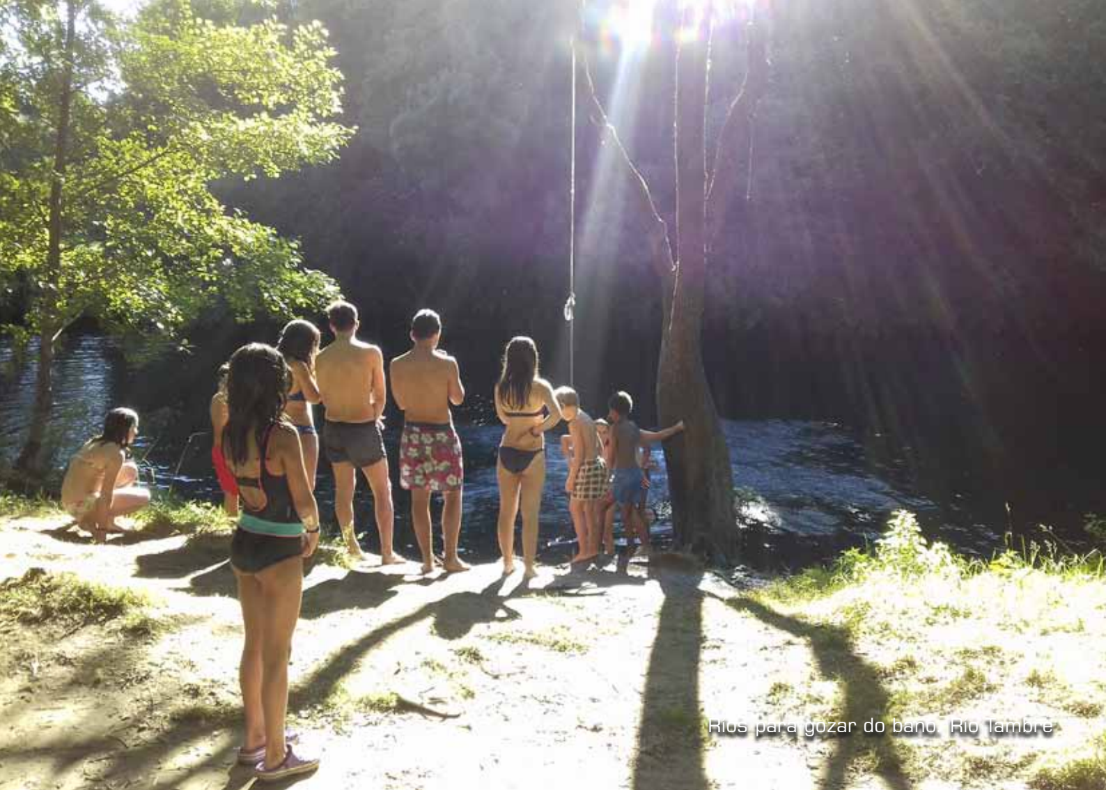
Rios para gozar do banho, Rio Tambore