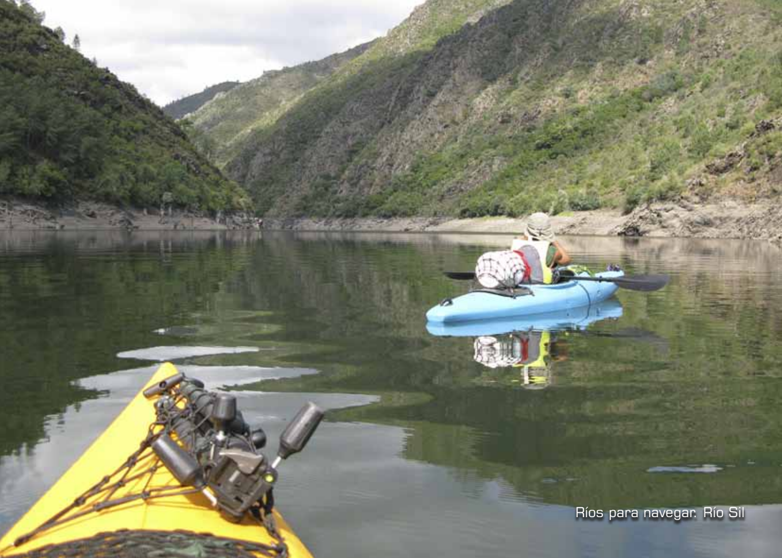
Ríos para navegar. Río Sil