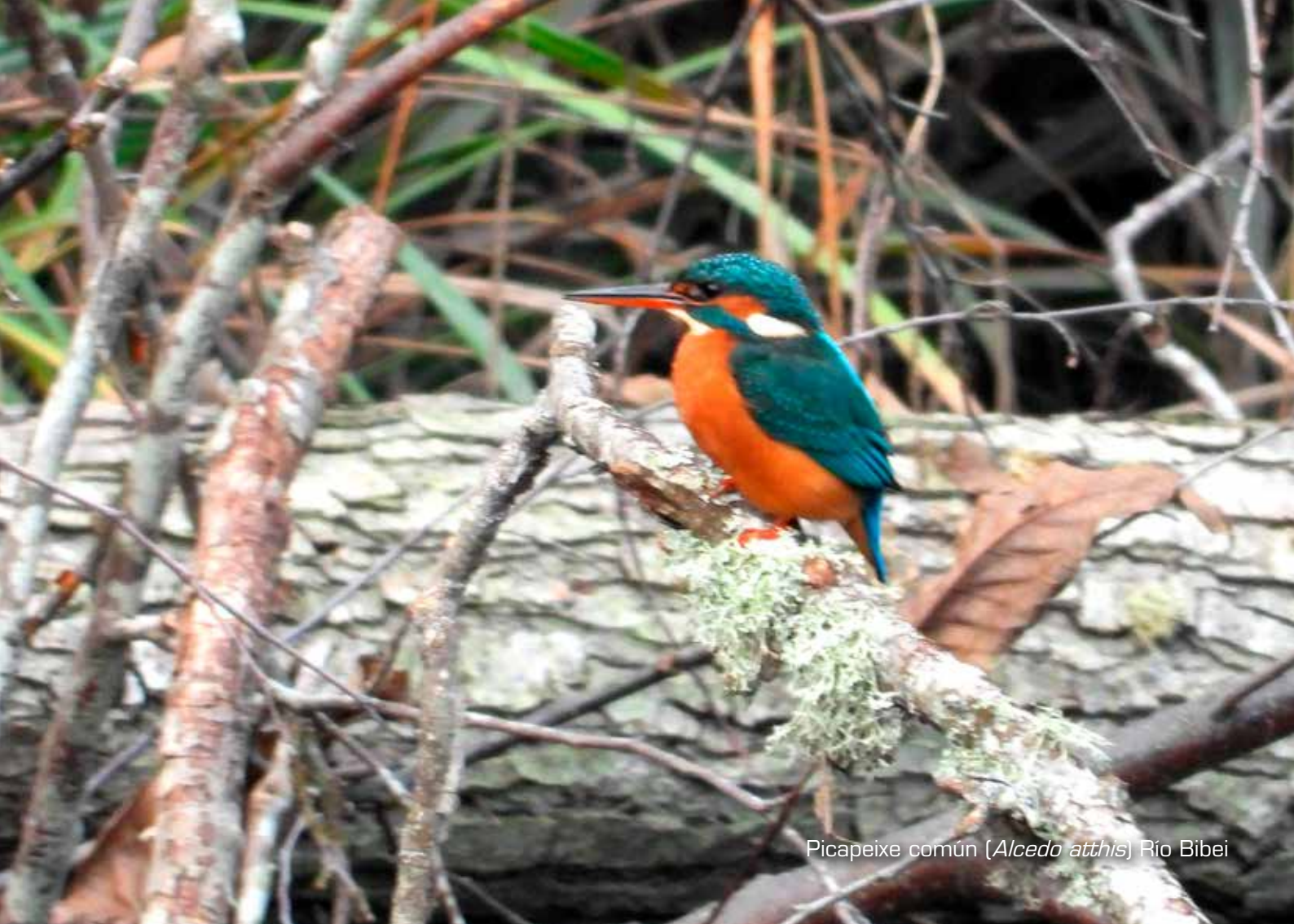
Picapeixe común ( Alcedo atthis ) Río Bibei