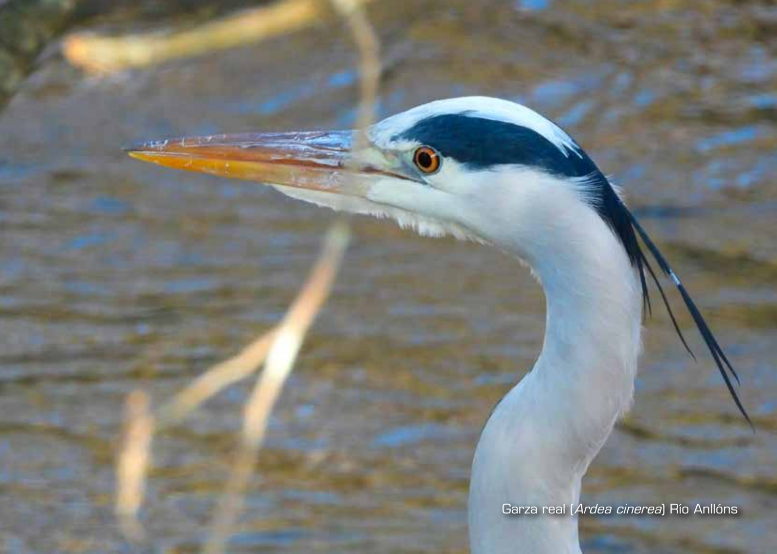
Garza real ( Ardea cinerea ) Río Anllóns