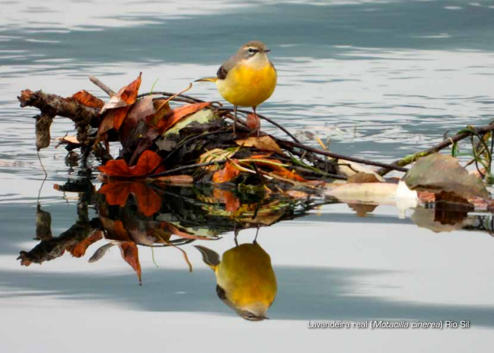
Lavandeira real ( Motacilla cinerea ) Río Sil