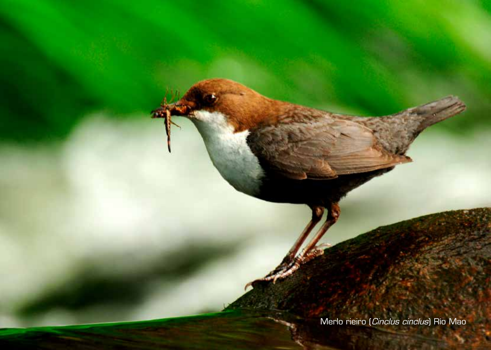
Merlo rieiro ( Cinclus cinclus ) Rio Mao