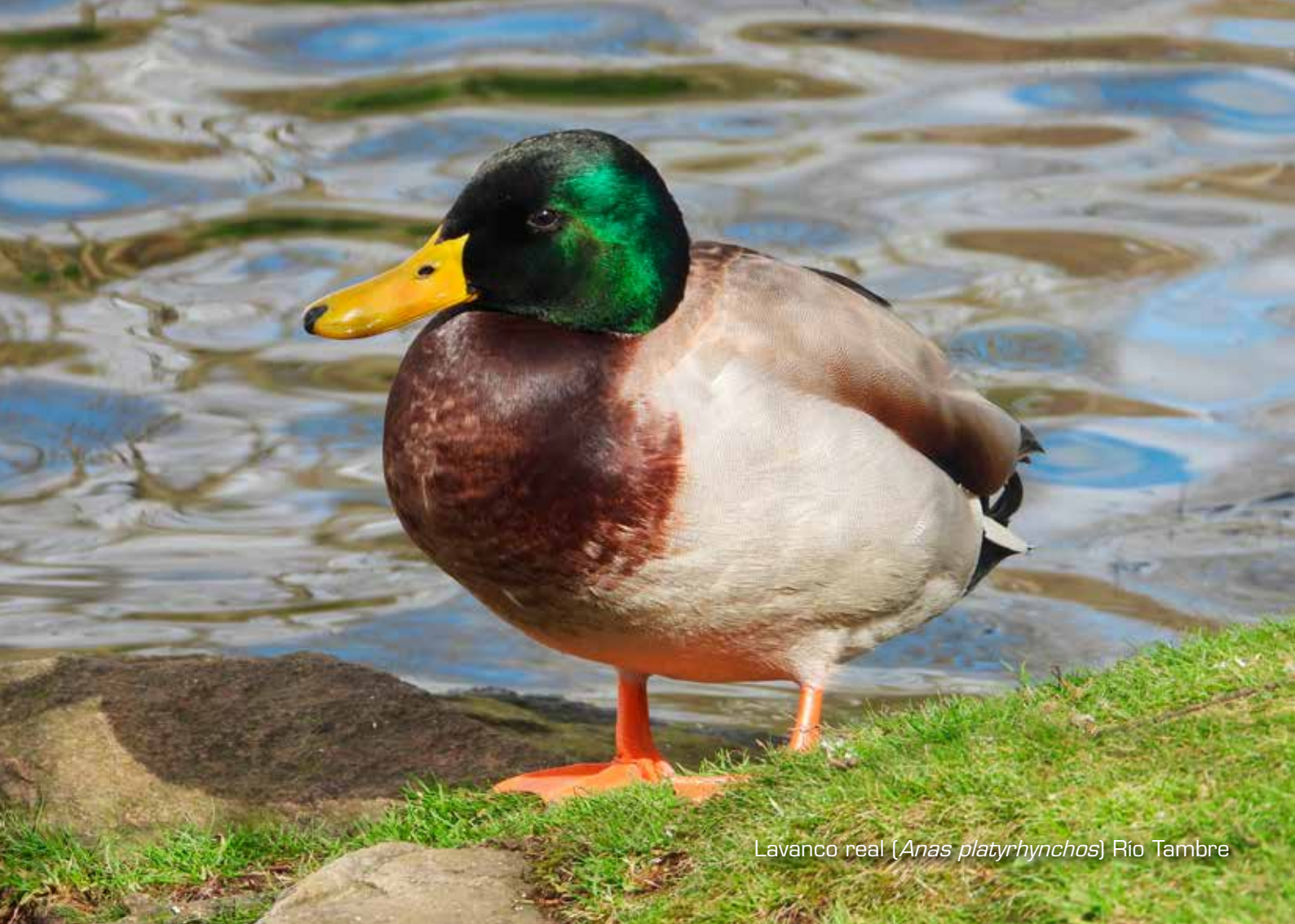
Lavanco real ( Anas platyrhynchos ) Río Tambre