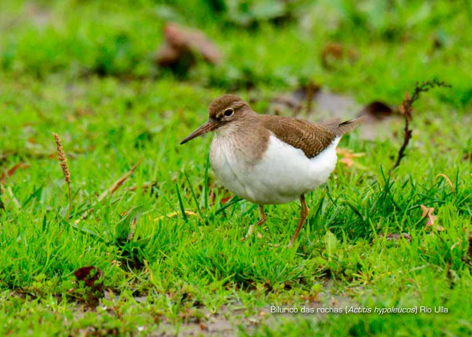
Bilurico das rochas ( Actitis hypoleucos ) Río Ulla